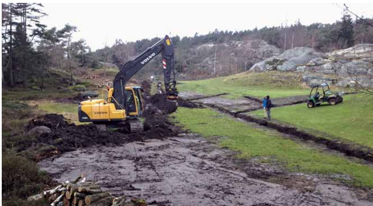
Dräneringsarbeten hål 7