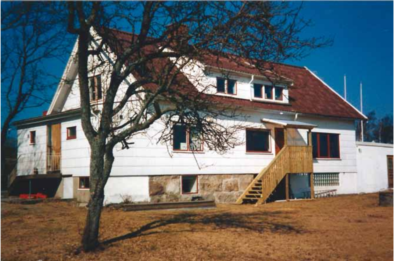
Gamla klubbhuset "Rävlanda gården"