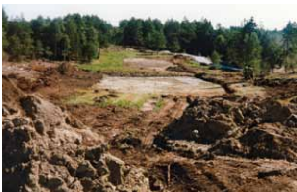
Anläggning hål 14