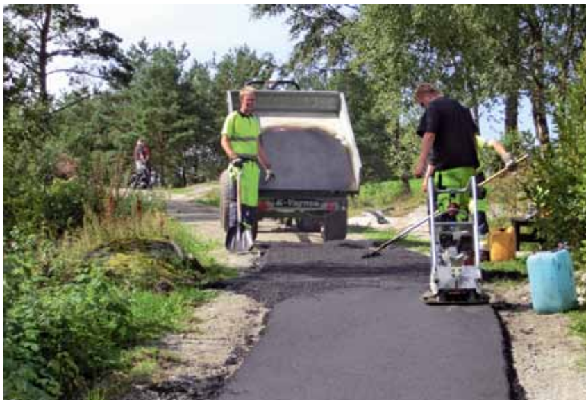
Asfaltering av branta backar

Våra övningsområden runt klubbhuset har också utvecklats på ett fint sätt med både nytt övningsfält vid entrén till klubben och en ny stor övningsgreen. Övningsgreenen nära klubbhuset anlades med delvis stöd från Svenska Golf förbundet som hjälp och belöning för klubbens satsning på ungdomar.