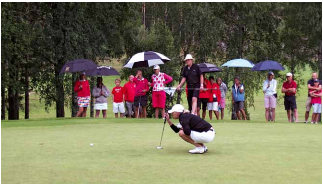
RM 2011 avgörs på andra sarspelshålet