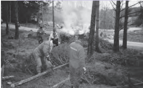
Röjning på hål 11