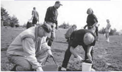
Stenplockning på 13:e fairway