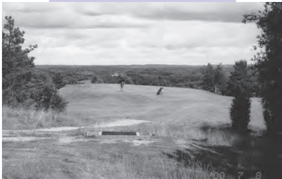
Nuvarande hål 16, före och efter bearbetning