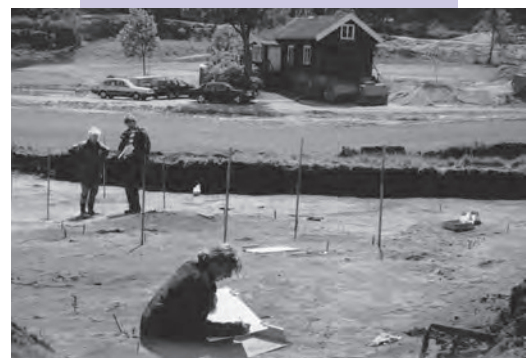
Arkeologiska utgrävningar på hål 13